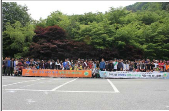
단체 기념 사진