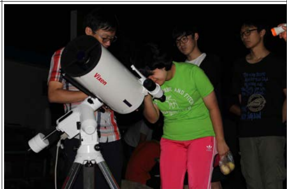
별자리 탐사 활동