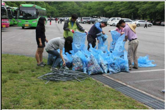
지도교사 분리 수거 작업