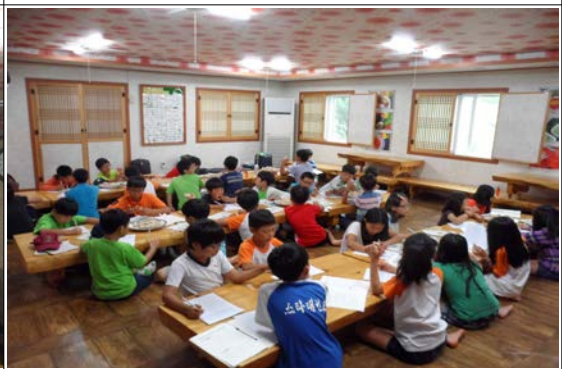
소감문 쓰기 및 발표