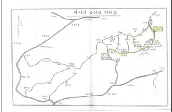
마이산 등산로 안내도