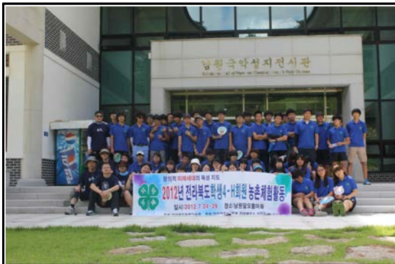
국악의 성지 판소리 배우기