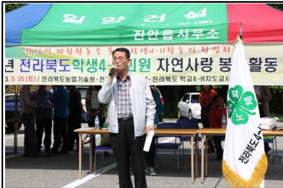
전라북도농업기술원 농촌지원과장 인사말