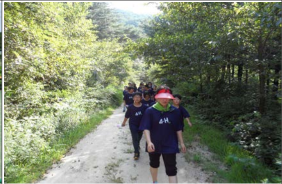
지리산 둘레길 탐방활동