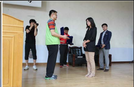
농업기술센터 4-H지도사 감사패 증정