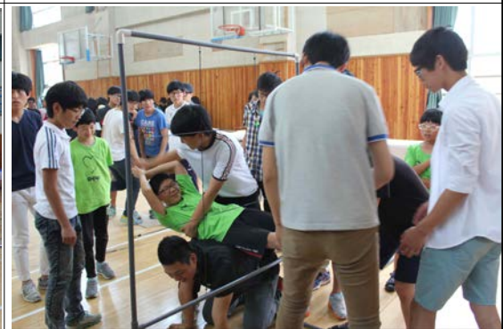
팀 빌딩프로그램(거미줄 통과하기)