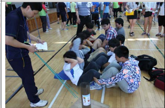
팀 빌딩프로그램(단체 윗몸일으키기)